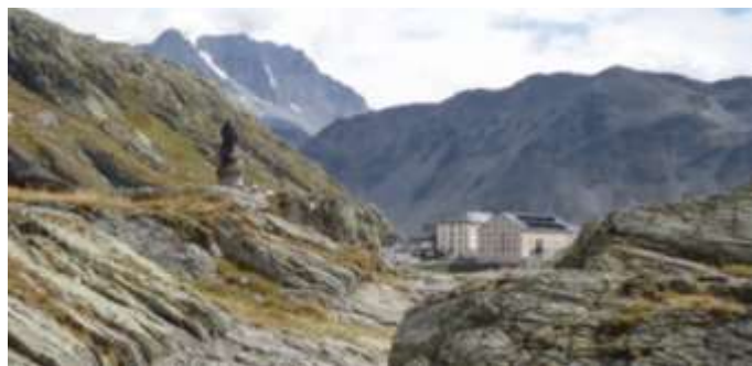
Strada romana, Colle Gran San Bernardo