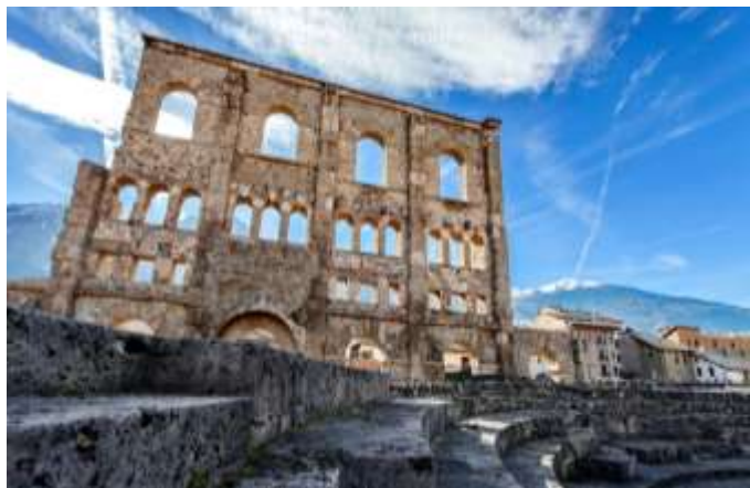
Teatro Romano, Aosta

Punto di partenza, Aosta , la città che dà il nome alla valle, con le sue vestigia d'epoca romana e medievale. Ma vale la pena scoprire anche tesori meno noti e DOVE,