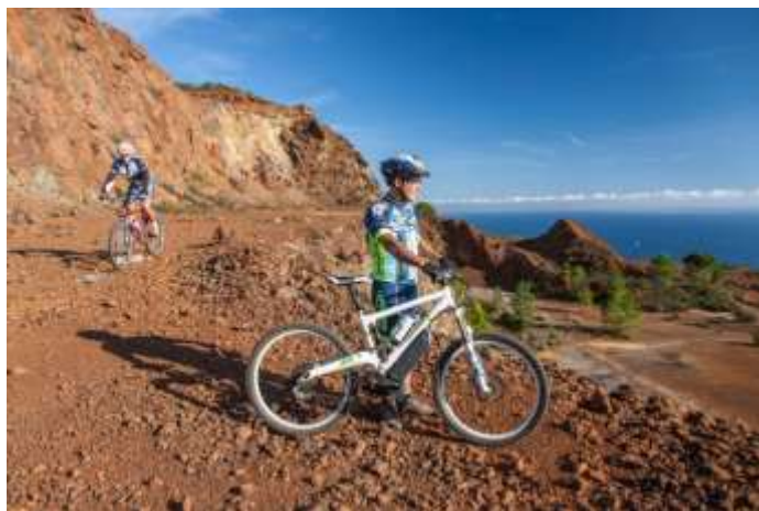
In mountain bike nell'area mineraria di Capoliveri

accessori: cappello, occhiali da sole, crema solare.