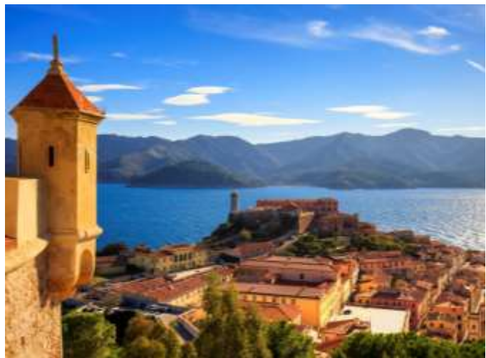
Una veduta di Portoferraio

Due gli sport tra cui scegliere. La mountain bike con pedalata assistita (il noleggio delle eBike è gentilmente offerto da Scott) da praticare nella zona di Capoliveri, con percorsi per esperti, come «La strada verso la leggenda» (30 km, dis. 1000 m), sulle orme dei campioni che, ogni anno, si sfidano nel parco minerario del monte Calamita e itinerari più semplici, adatti a famiglie con bambini. Saranno invece nel versante ovest, tra San Piero e Marciana Alta, i percorsi di trekking : facile come quello de «Il paese degli scalpellini» o impegnativo, come «Alle pendici del Monte Capanne» (13 km, dis. 900 m.).