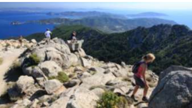
Trekking sul Monte Capanne

Si parte, il 12 maggio, con « Il paese degli scalpellini » (1,5 km) nel centro storico di San Piero, tra portali di pietra e scorci sul mare; il secondo « Le vie del Granito » (5 km), si allarga dal paese alla vegetazione; infine il terzo, il più impegnativo, « Masso alla Quata » (13 km, dislivello 740 m.), che si snoda tra massi di granito e boschi.