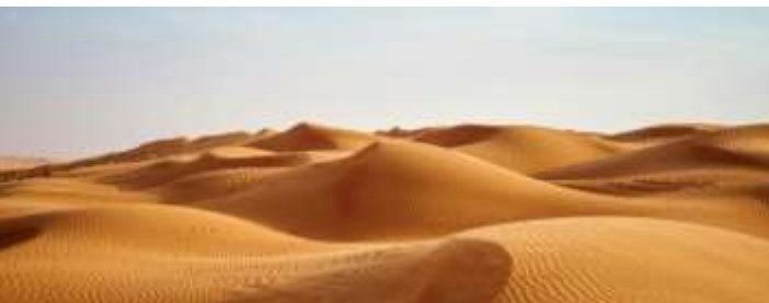
DESERTO DI WAHIBA

Al termine rientro in hotel e tempo a disposizione per relax in piscina o shopping. Pranzo libero. Cena in un caratteristico ristorante della città. Pernottamento in hotel.